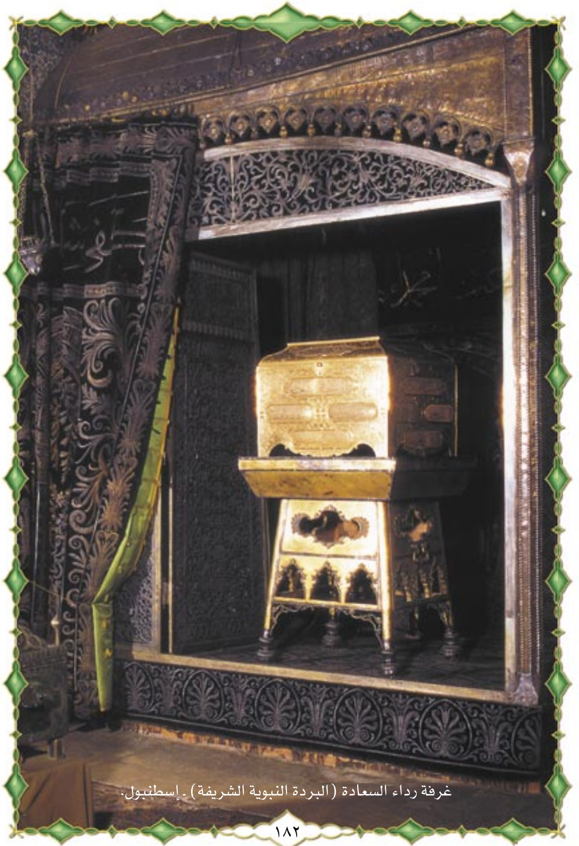
غرفة رداء السعادة (البردة النبوية الشريفة) - إسطنبول.